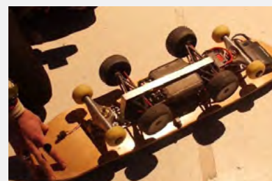
Holy Vj , A. Schweitzer / C. Sadoul, décembre 2014