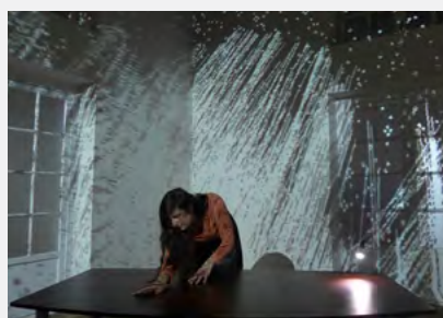
La maison sensible , Scenocosme / Lola&Yukao Meet, 2016