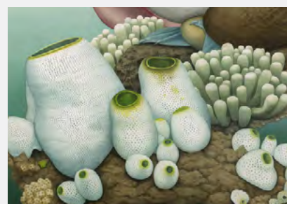
La vie sexuelle des corps célestes , N.Tardif, 2016