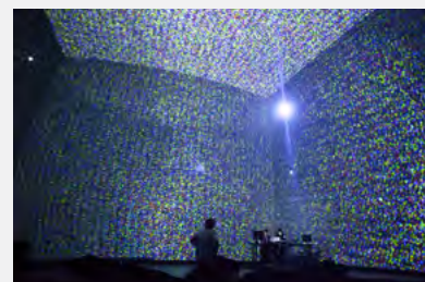
Dromos , Maotik / Fraction, janvier 2014