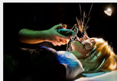
Bodyscape , Body Scape, juin 2015