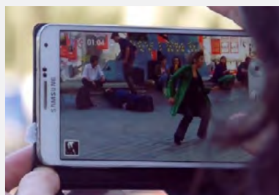
Journal d'un seul jour , Compagnie Acte, mai 2015