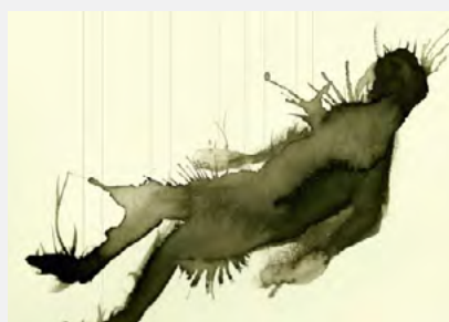
Uber Beast Machine , Cie la Méta-carpe, 2016 crédit : La Méta-carpe

Pour toute question : vph [at] aand [point] org